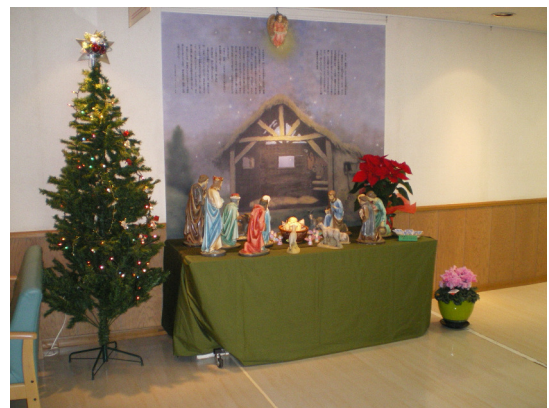
クリスマスの飾りつけ